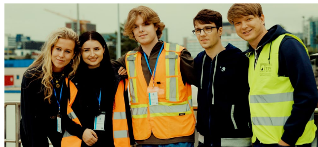
Projet mobilité : Francfort, Allemagne | Département Génie

Maroc | Département Sciences sociales Belgique-France | Form. continue et service aux entreprises Kodzé, Togo | Département architecture Cluse, France | Département génie mécanique France, Île de Corse | Dép. d'éducation physique La Havane, Cuba | Département de musique Francfort, Allemagne | Département Génie