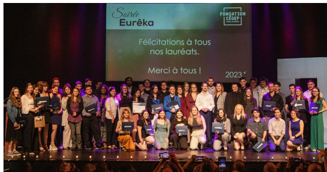
Gala Eurêka 2023 | Lauréats