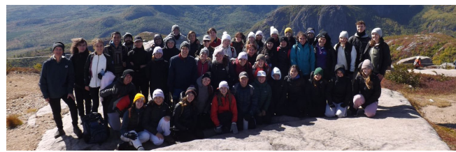
Projet étudiants et pédagogiques Excursion en milieu naturel | Sciences, Lettres et Arts

Excursion en milieu naturel | Sciences, Lettres et Arts Sortie double au Théâtre | Littérature, Arts et Cinéma Expo Bois Design 7e édition | Design intérieur Prix littéraire collégiens | Littérature et communication PhiloNeige | Philosophie prog. Histoire et civilisation Semaine de la Philo, 11e édition | Philosophie Gala publicitaire Phoenix 2023 | Tech. administratives